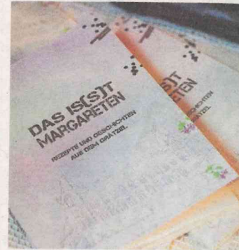
Das Buch bietet eine Vielfalt an Rezepten.

Im Margaretnr Grätzel-Kochbuch finden sich 50 Rezepte aus 20 verschiedenen Ländern – von der Waldviertler Milchsuppe bis zu den somalischen Krapfen. Die erste Auflage