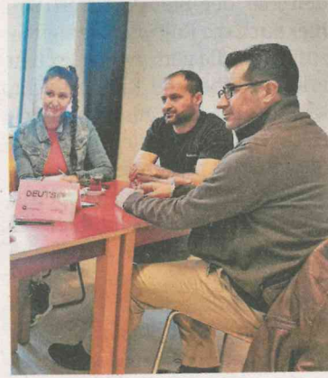
Die Teilnahme am Sprachencafé ist kostenlos.

Anmeldung ist dafür nicht notwendig. Zudem ist das Angebot kostenlos und steht jedem offen.